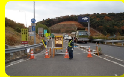
椎田IC 行橋方面への入口の封鎖状況