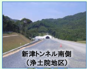
新津トンネル南側（浄土院地区）

また、今後の路面を仕上げる舗装工事やトンネル防災施設、照明などの設置工事を進めるにあたって、みなさまの生活環境維持に努め、工事の安全にも留意して作業を行っていきますので、今後ともご理解・ご協力をよろしくお願いいたします。