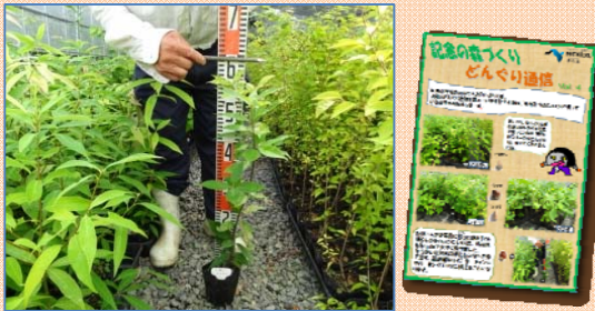
どんぐりはみなさんの名札を付けて、緑化センターで大切に育てています。

緑化センターで育てているどんぐりの苗木は、当時拾ってもらった小学校のみなさんと一緒に、開通までにICなどの緑地帯に植樹を行う計画を考えています。