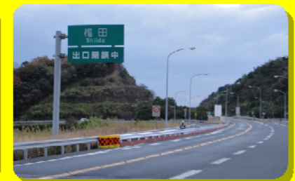
椎田IC 行橋方面からの出口の封鎖状況