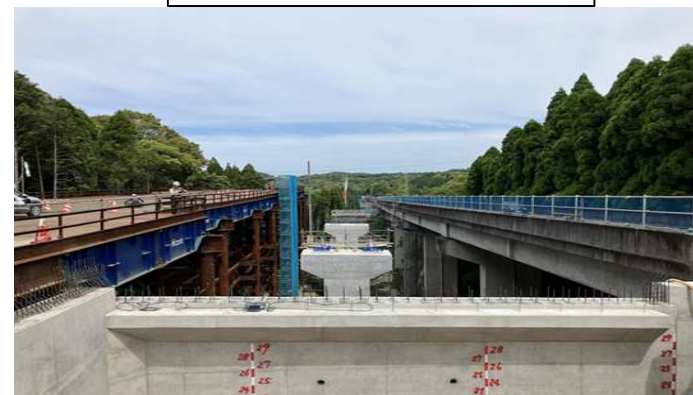
③牧之角橋近景の様子