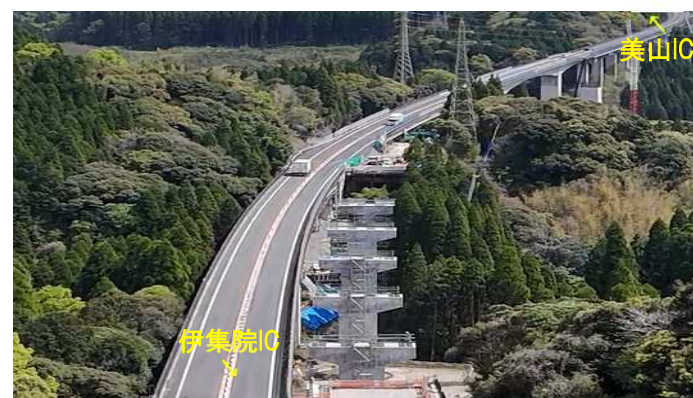
①牧之角橋付近(航空写真)