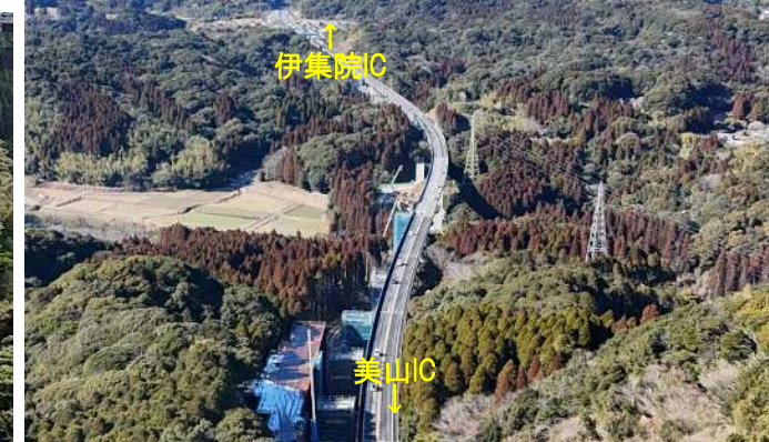
②神之川橋付近(航空写真)