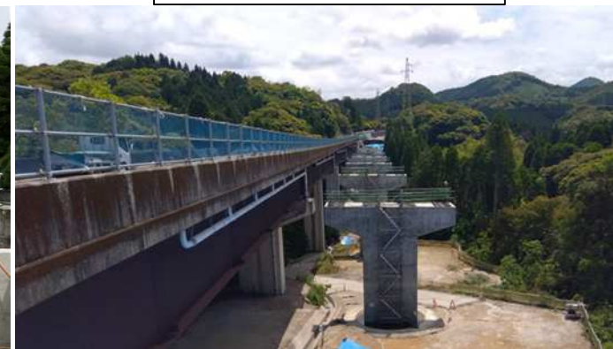
④神之川橋近景の様子