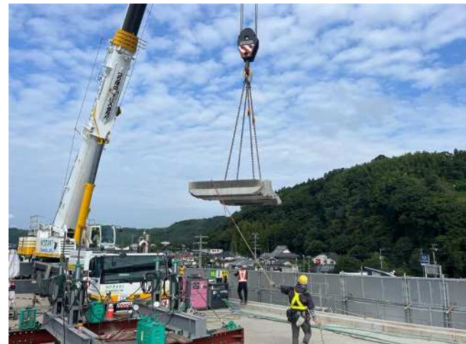
床板取替工事の様子