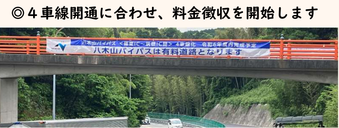
◎ 4車線開通に合わせ、料金徴収を開始します