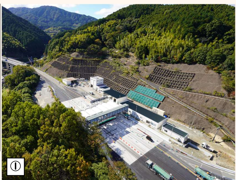
① ○篠栗本線料金所 舗装やETC設備等、料金所付近は工事内容が多くありますが、通行車線を切替しながら、通行止め規制を行うことなく施工しています。本事業業の中で最も様変わりする箇所です。料金所や車庫などの建物も完成に向け動いています。