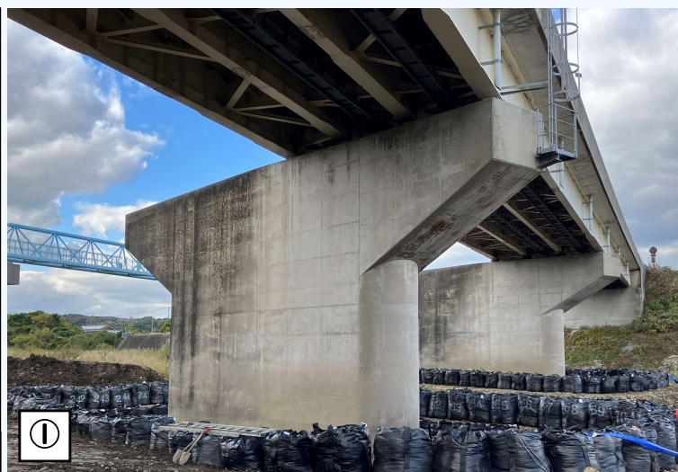
① ○城井川橋下部工 耐震補強 (RC巻き立て) のため、一期線と一体型の下部工において構造物掘削を行っています。