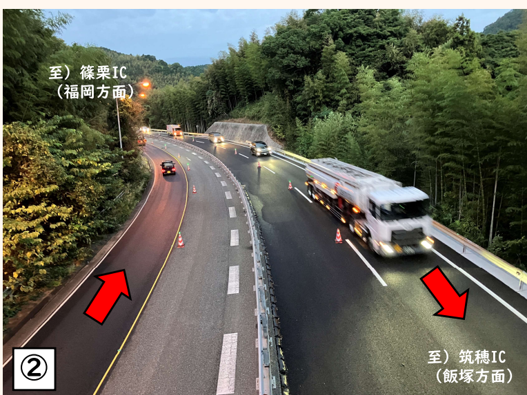
② ○対面通行が解消しました 10月16日(水)朝5時、篠栗IC~筑穂ICの対面通行が解消しました。令和6年度の完成に向け、中央分離帯や道路施設工事を進めていきます。