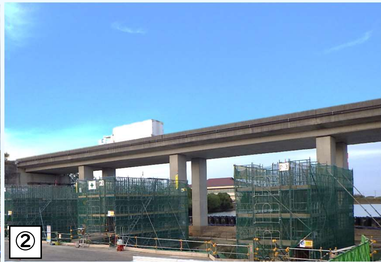
② ○双子池橋下部工 双子池の締め切後、橋梁の下部工を施工するための足場を組んでいます。