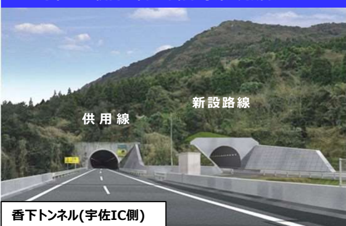
香下トンネル(宇佐IC側)