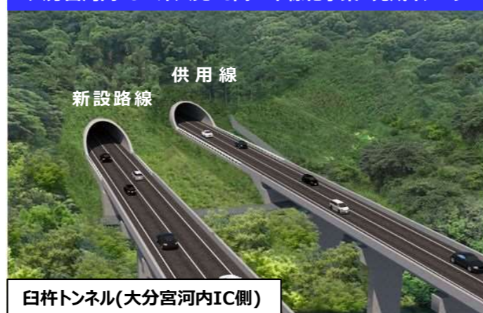
臼杵トンネル(大分宮河内IC側)