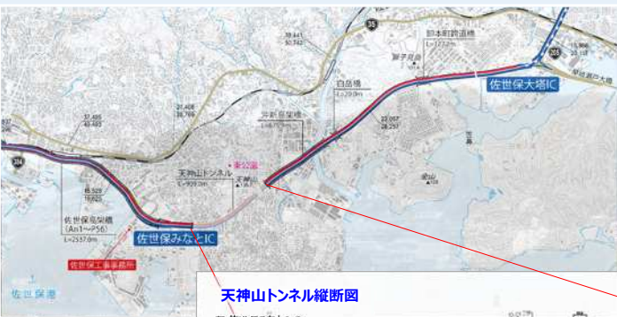
天神山トンネル縦断面図