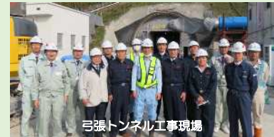
弓張トンネル工事現場