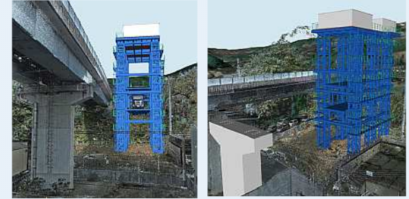
— 完成イメージ —