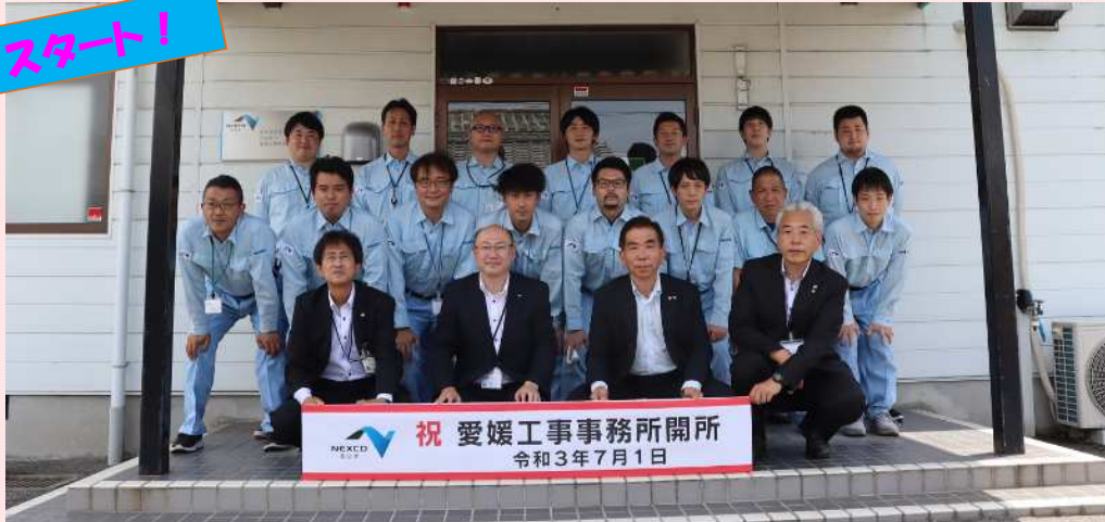
祝 愛媛工事事務所開所 令和3年7月1日