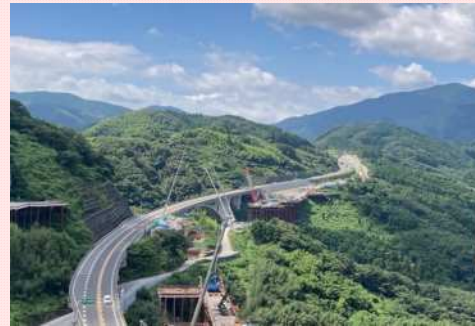
明神山TNから宇和島(南側)方面の様子

松山IC～大洲ICの4車線化等事業は、伊予IC～大洲IC間において、伊予～内子五十崎6.3km(内子五十崎～大洲)4.4km、伊予～内子五十崎9.7kmの3箇所です業化されています。 現在、伊予～内子五十崎6.3km区間では工事全面展開中であり、他の2区間は調査設計を進めています。 4車線化により災害時通行止め区間の早期啓開が図られ、災害時の通行止め時間の最小化などに寄与することで、強靱で信頼性の高い高速道路ネットワークが形成されます。