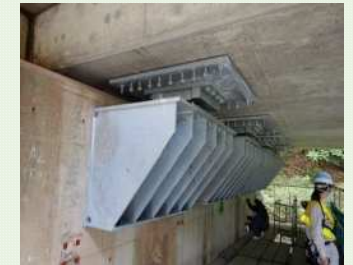
水平力分担構造設置の様子

南海トラフ地震など災害時において、緊急輸送路としての役割が期待されています。 現在の落橋・倒壊の防止対策に加え、地震後緊急輸送道路としての機能を速やかに回復できることを目指し、更なる耐震補強工事を実施しています。 10月末現在、上下線合わせて12本の橋梁で耐震補強工事が進行中です!