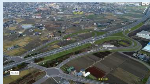
東温スマートICイメージパース(南西から)

松山自動車道東温スマートIC事業がH30.8事業化されました。 東温スマートICの整備により、隣接する工業団地や医大付属病院から高速道路へのアクセスが向上し、地域産業活性化や医療サービス向上、また災害発生時の救護活動支援など、期待されています。