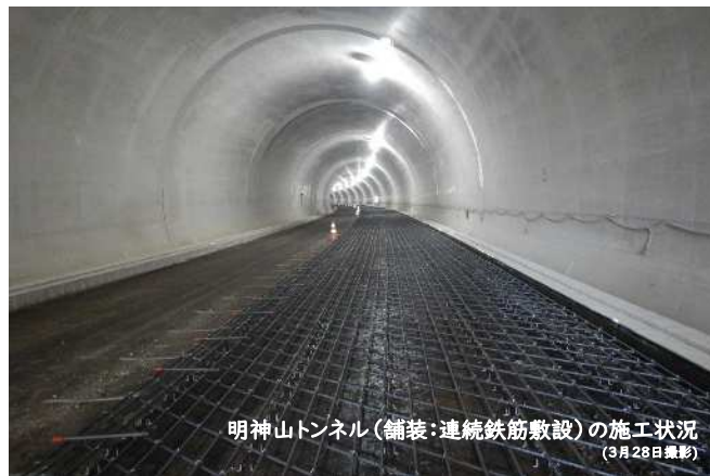
明神山トンネル (舗装:連続鉄筋敷設) の施工状況 (3月28日撮影)