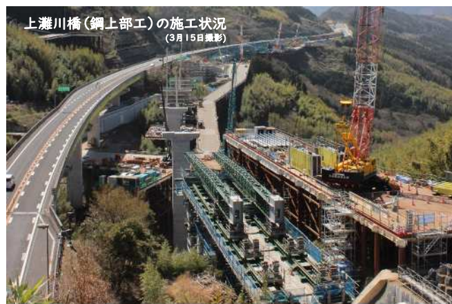
上灘川橋 (鋼上部工) の施工状況 (3月15日撮影)

今後、5月の夜間通行止めの中で、仮設防護柵の設置を行う予定です。また、工事用仮橋を設置するための進入路の整備を進めてまいります。