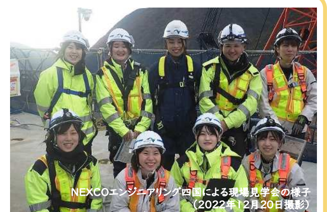
NEXCOエンジニアリング四国による現場見学会の様子 (2022年12月20日撮影)