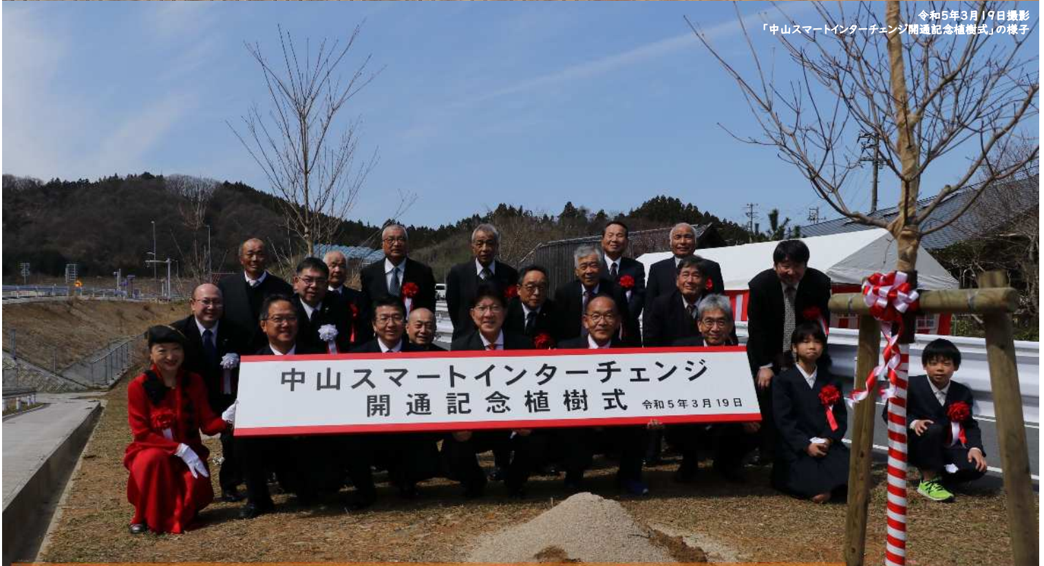
令和5年3月19日撮影 「中山スマートインターチェンジ開通記念植樹式」の様子