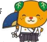
愛媛県イメージキャラクター みんちゃん 登録番号: 42027

今年も、工事の安全管理を第一に、無事故・無災害での工事遂行を徹底してまいります。