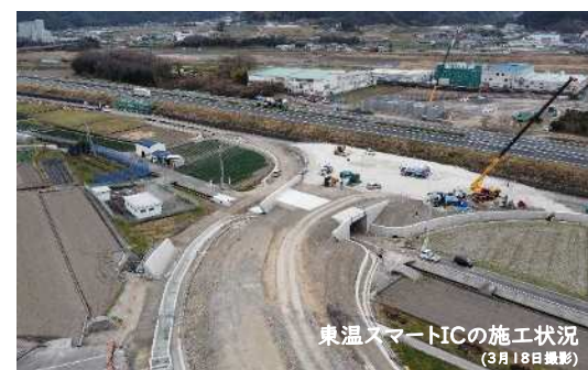
東温スマートICの施工状況 (3月18日撮影)