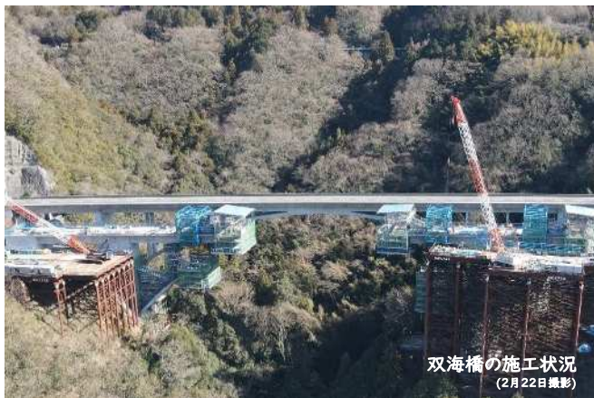
双海橋の施工状況 (2月22日撮影)