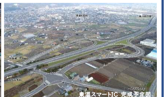
東温スマートIC 完成予定図