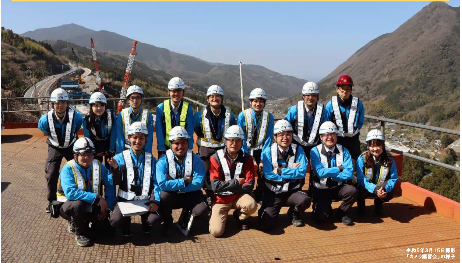
令和5年3月15日撮影 「カメラ講習会」の様子