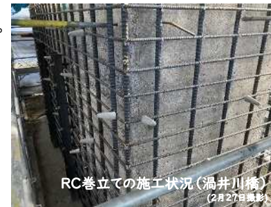
RC巻立ての施工状況 (渦井川橋) (2月27日撮影)

関川橋では、吊り足場の設置が完了しました。これからトラス桁補強のため、この上にくさび式足場を設置する予定です。