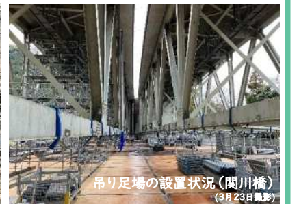
吊り足場の設置状況 (関川橋) (3月23日撮影)