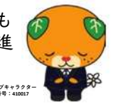
愛媛県イメージキャラクター みんちゃん 登録番号: 42027

供用車線への影響が無いよう、無事故・無災害での工事遂行を目指し、安全管理を最優先に、1日も早い完成に向けて事業を進めてまいります。工事推進に向け、ご理解とご協力をお願いいたします。