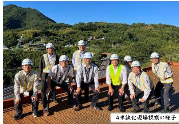
4車線化現場視察の様子