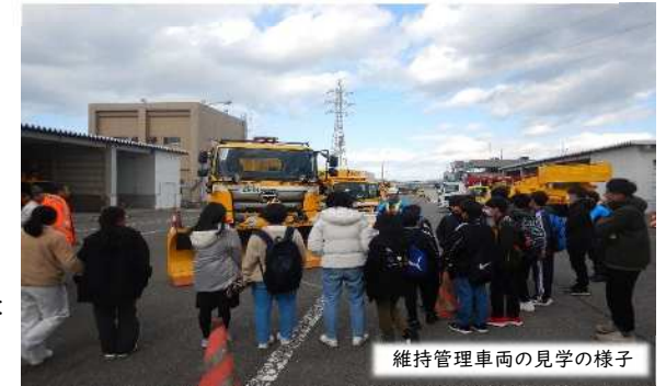
維持管理車両の見学の様子

東温市のジュニア体験塾に参加する中学生約20名を対象に、建設現場の見学、高速道路を管理する業務の見学・体験を実施しました。愛媛工事事務所では、伊予IC～内子五十崎IC間の4車線化区間(約6.3km)において事業の概要、車線の切替状況や中山SIC付近の工事状況を見学していただきました。愛媛高速道路事務所では、交通管理隊より①高速道路で故障した場合の対応の説明②交通規制の実演見学③旗振り体験をしていただきました。また、日頃見ることができない維持管理車両(除雪車等)を見学していただきました。