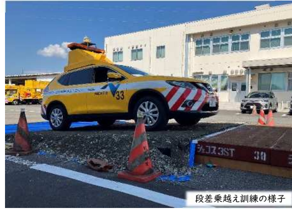
段差乗越え訓練の様子

愛媛高速道路事務所及び愛媛工事事務所合同で防災訓練を実施しました。毎年9月に社員の防災意識向上を目的に実施しています。当日の訓練では愛媛工事事務所において、非常参集訓練、事務所内の防災資材の確認や若手社員を対象に黄色パトロールカーの実車説明会等を実施しました。また、愛媛高速道路事務所においては、地震により高速道路上に段差ができた時に、早期に緊急車両の通行ルートを確認するための段差乗越え訓練も実施しました。