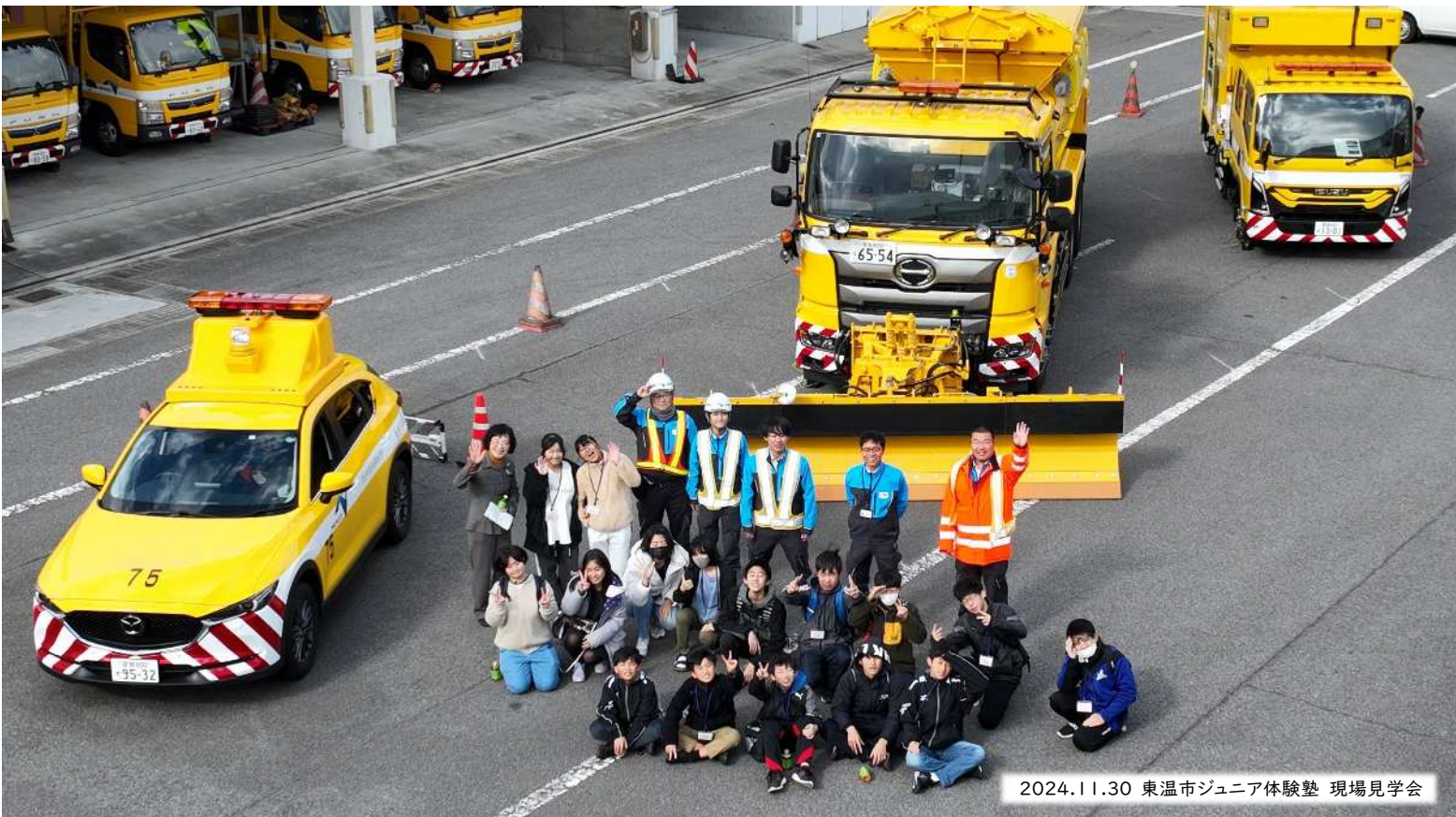
2024.11.30 東温市ジュニア体験塾 現場見学会