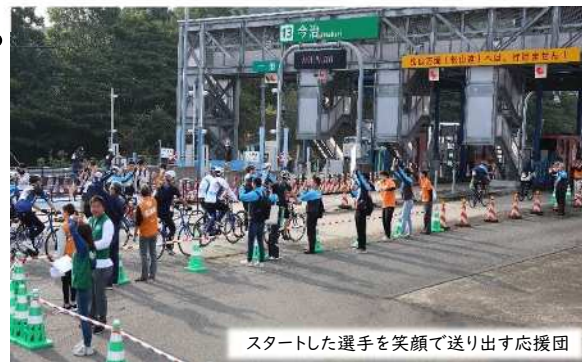
スタートした選手を笑顔で送り出す応援団

「サイクリングしまなみ2024」にNEXCO西日本から6名が参加し、約40kmのコースをロードバイクで走りました。サイクリングしまなみとは、愛媛県等が主催し、高速道路を規制して行う日本最大規模のサイクリング大会です。瀬戸内しまなみ海道の魅力堪能できる8つのコースがあり、気候と豊かな自然に育まれたおいしい食べ物をいただくことができる等、瀬戸内の島ならではのおもてなしを感じることでできるイベントです。当日は、愛媛高速道路事務所及び愛媛工事事務所へ応援団を結成し、選手の皆様に沿道で応援しました。