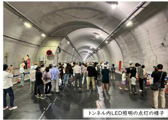
トンネル内LED照明の点灯の様子

松山自動車道 伊予IC～内子五十崎IC間の4車線化区間(約6.3km)において沿道にお住まいの方約70名を対象に4車線化完成前の高速道路でウォーキングイベントを開催しました。イベントでは、4車線化事業の概要説明、明神山トンネルの避難連絡坑の説明やジェットファンの稼働体験を行った後、トンネル内及び橋梁上を歩いていただきました。参加者の皆様からは、「普段車で走っている高速道路を歩くことができ、貴重な体験ができた。」「ジェットファンの風力が想像していたよりも強く、飛ばされるかと思った。」等、たくさんの感想をいただきました。今後もイベント等を通して4車線化事業のPR・理解促進に努めてまいります。