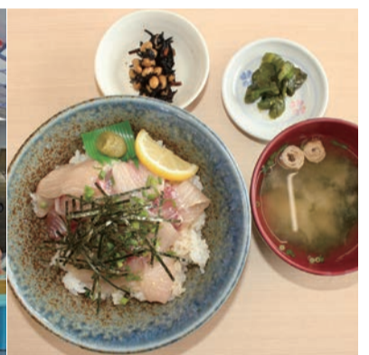
▲ワーサン亭のハマチ丼