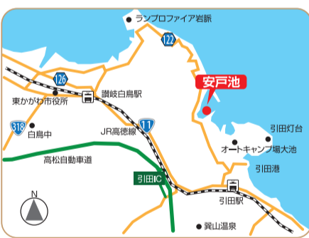
株式会社ソルトレイクひけた 香川県東かがわ市引田4373番地 ☎0879-33-2800