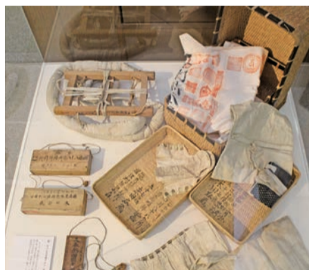
▲お遍路さんが昔使っていた後(リュックサック)

年間数十万人が訪れる四国霊場八十八カ所。結願寺である大窪寺への遍路道沿いにある「おへんろ交流サロン」は今年で開設16年目を迎えます。遍路資料展示室では、紀行本や古地図、また接待を受けたお遍路さんが残した江戸中期からの納札や古い納経帳、手形など、四国遍路の歴史を感じさせる貴重な資料となる品々が展示されています。 四国霊場のジオラマや、日本分県里程図も展示されており、お遍路さんが気軽に立ち寄り話に花を咲かせる休憩コーナーにはお茶やお菓子のお接待も。霊場巡りの参拝者や観光客の名所として、また地域住民との交流の場としてもご利用いただけます。 長い歴史を超えて地域と共存し継承されてきた、四国が世界に誇る生きた文化遺産として、高野山開山1200年の今年、4月2日から