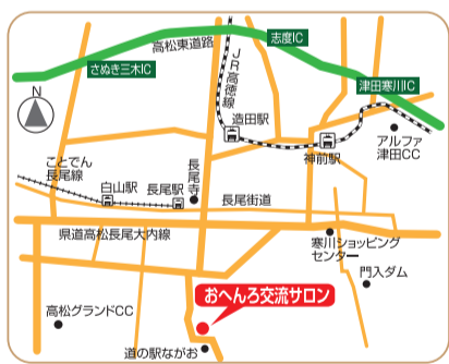
おへんろ交流サロン 香川県さぬき市前山936番地 ☎0879-52-0208