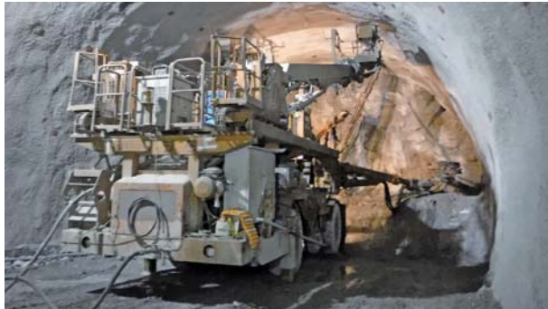
トンネル掘削の様子

2015年3月11日～ 2017年8月26日 《津田トンネル》現在、トンネルの掘削と並行して防水工及びトンネル覆工コンクリートを施工しています。 (トンネル900メートル/968メートル(93.0%) 《神野高架橋》橋台・橋脚を施工しています。 《神ノ上池橋》橋脚1基の施工が完了しています。