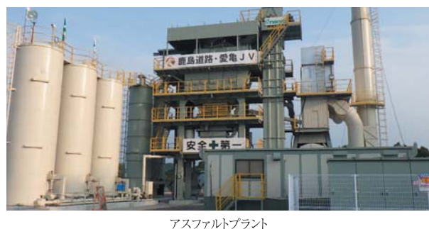
アスファルトプラント