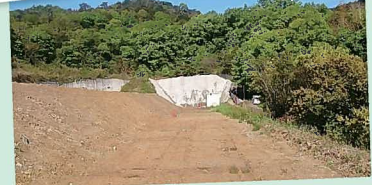
トンネル掘削と並行して、坑口周りの整備をしています