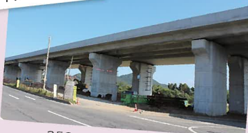
252mの橋梁が完成です