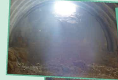
トンネルは貫通を迎え、坑口の整備をしています