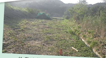
作業は草刈から始まりました