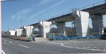
橋脚が立ち上がってきました