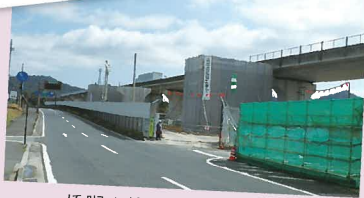
橋脚の施工が始まりました