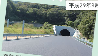
舗装が整備され、概成を待つのみです