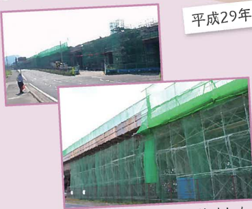
橋桁が架かり、橋脚間がつながりました