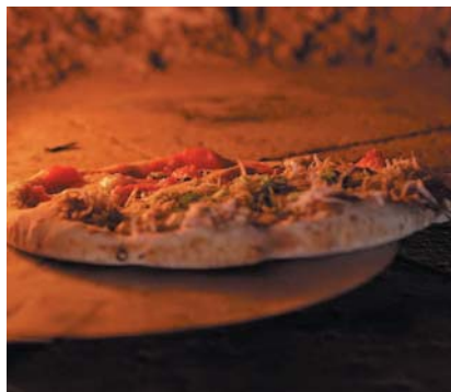
土日には本格ナポリ窯で焼く「醤油ピザ」が味わえる

ことで、バランスのよい深い味わいと旨みを持つ醤油を生み出すことができます。また、おいしさと安全性を守るため、使用する大豆や小麦はすべて国産。かめびし屋の醤油には、作り手の愛情や熱い思い、多くのこだわりがたくさん詰め込まれています。このため、かめびし屋ならではの醤油を求めて、訪れるお客様も多