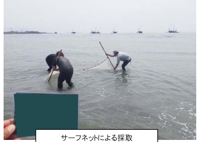
サーフネットによる採取