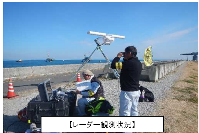
【レーダー観測状況】

調査実施日：令和2年4月22日～令和2年4月23日、令和2年5月1日～令和2年5月2日