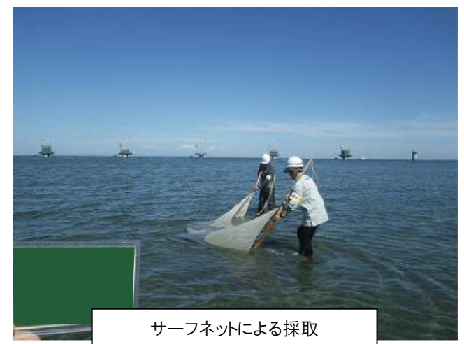
サーフネットによる採取