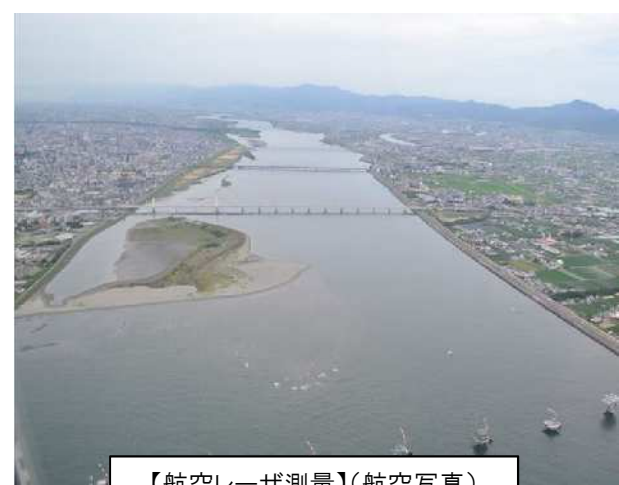
【航空レーザ測量】(航空写真)