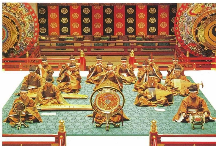
『雅楽（公益財団法人 菊葉文化協会 発行、宮内庁式部職楽部 監修）より抜粋』

『雅楽は、千数百年の伝統を有し、世界で最も古い音楽文化財として貴重な歴史的価値をもつものであり、昭和30年、宮内庁式部職楽部の楽師が演奏する雅楽は国の重要無形文化財に指定され、楽師の全員が重要無形文化財の保持者に認定されております。さらに、平成21年には、ユネスコ無形文化遺産保護条約「人類の無形文化遺産の代表的な一覧表」に記載されました。このように雅楽は、今後伝承されていくべき我が国の伝統文化として国際的にも認知されており、雅楽それ自体が発展し広まるとともに、他の音楽・舞踊に影響を与えていく可能性を有しております。』