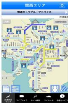
↑ 交通状況マップ ↑