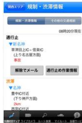
↑ 通行止解除通知 ↑