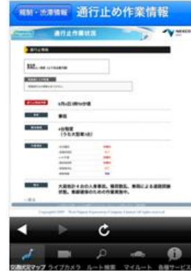
↑ 通行止作業状況 ↑