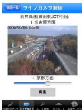
↑ 道路映像 ↑