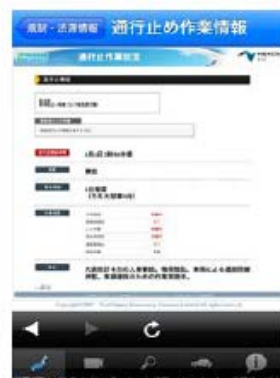
↑ 通行止作業状況 ↑