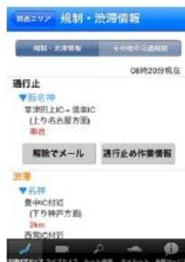
↑ 通行止解除通知 ↑