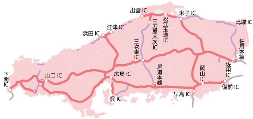
【a. 中国5県周遊プラン】