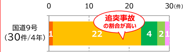
【事故類型別死傷事故件数】