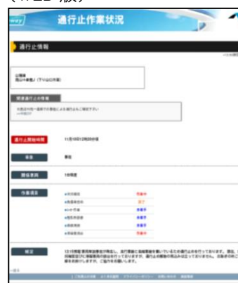
通行止め作業状況