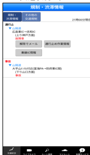
通行止め解除通知