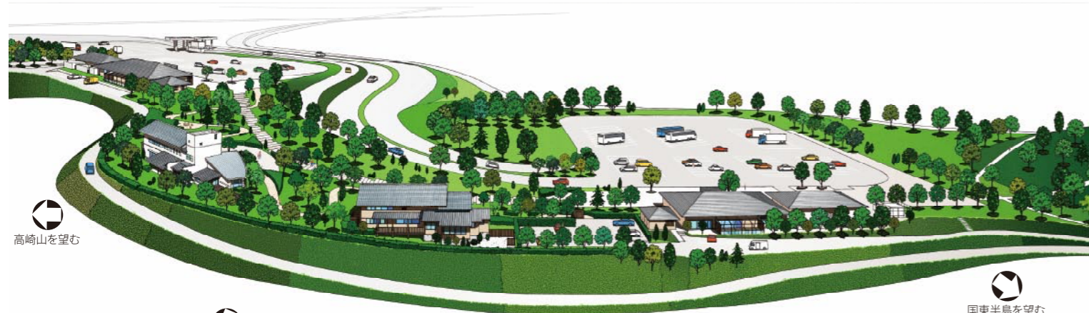
高崎山を望む 別府湾を望む 国東半島を望む

玄林館(上り線) + アルテジオダイニング B-speak cafe + 不生庵・善舎 + 玄林館(下り線)