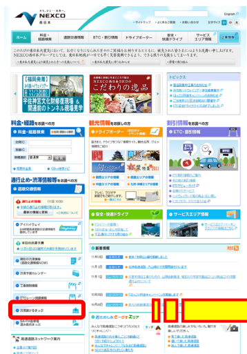
NEXCO西日本ホームページよりアクセス

混雑しているSA等の手前や先のPAが混雑していない場合がありますので、ぜひご活用ください。特に、お食事の時間などはSA・PAの駐車場は大変混雑することが予想されますので、この地図を参考にいただき、少しでも混み具合の低いSA・PAをご利用になれるか、ご利用時間帯をずらすなど、ひと工夫加えられることをおすすめします。