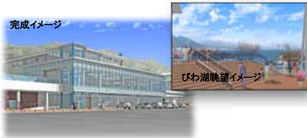
びわ湖眺望イメージ