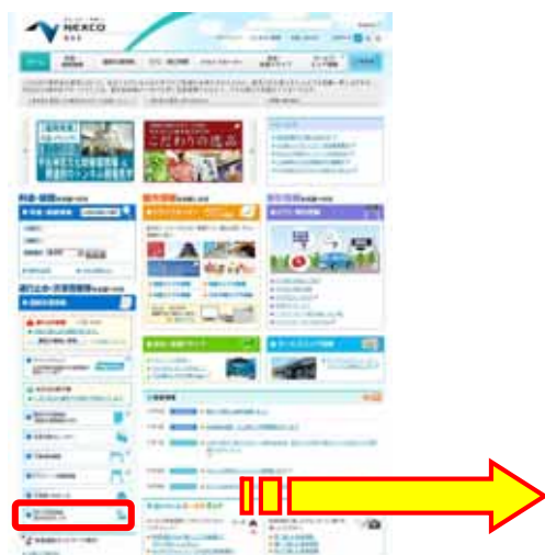
NEXCO西日本ホームページよりアクセス

混雑しているSA等の手前や先のPAが混雑していない場合があります ので、ぜひご利用ください。特に、 お食事の時間などはSA・PAの駐車場は大変混雑することが予想されます ので、この地図を参考にいただき、 少しでも混み具合の低いSA・PAをご利用になれるか、ご利用時間帯をずらす など、ひと工夫加えられることをおすすめします。