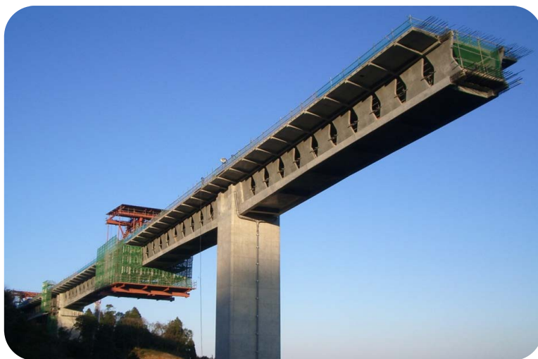
東九州道 寺迫ちょうちょう大橋