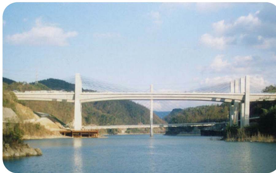
山陽道 つくはら 衝原橋