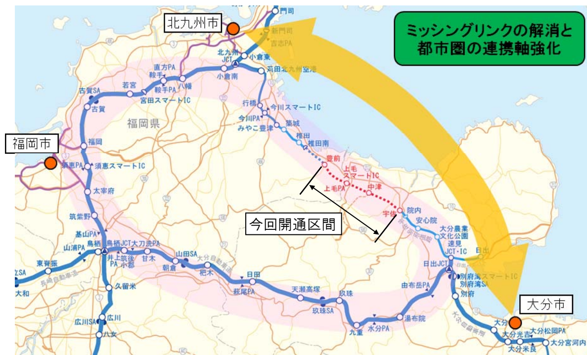
豊前市～大分市間 時間短縮効果

東九州自動車道が北九州から大分まで繋がった場合、北部九州のミッシングリンクが解消され、北九州市～大分市間の所要時間がすべて一般道路を利用した場合と比較し約95分間の短縮となり、福岡、北九州、大分都市圏の連携軸が強化され、更に東九州域を中心に地域交流が活発になることが期待されます。 ※平成27年1月21日17時30分訂正