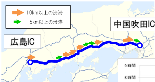
広島IC⇒中国吹田IC (山陽道経由) 出発時間別の所要時間