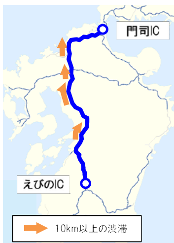
えびのIC⇒門司IC (九州道経由) 出発時間別の所要時間