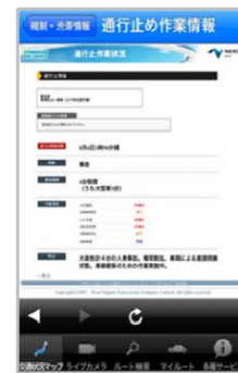
通行止め作業状況