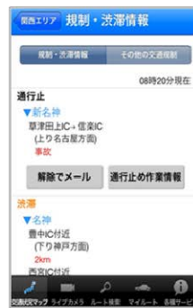
通行止め解除通知