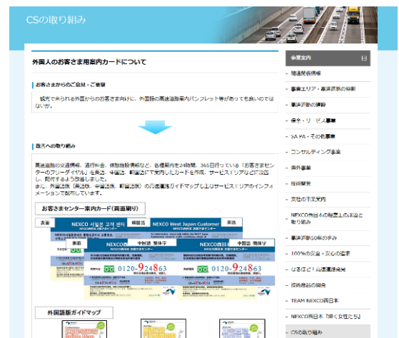
ホームページ掲載例