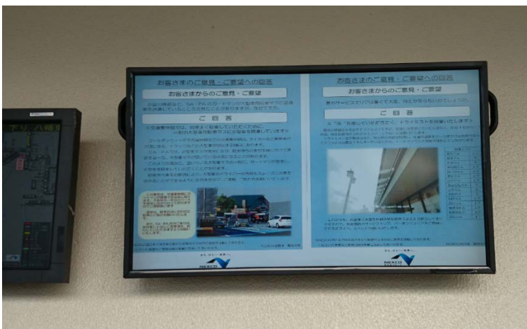
サービスエリア掲示例

お客様からいただいた声をもとに改善した事例は、サービスエリアやパーキングエリアで改善状況を掲示しています。また、ホームページでも紹介しています。