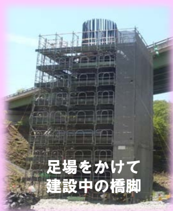
足場をかけて建設中の橋脚

現場は工事最盛期であり、開通後には見ることができない迫力のある高速道路の現場をぜひご覧ください!