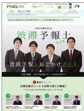
※渋滞予報士(東日本)