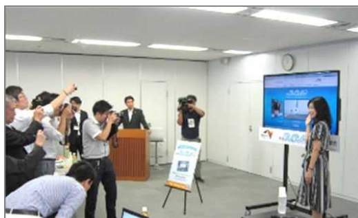
※高速道路ドライブアドバイザー(中日本)