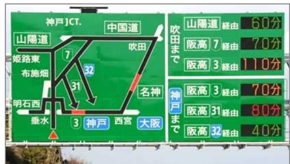
※図形情報板(神戸淡路鳴門自動車道)