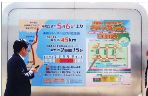
※大型ポスターによる経路選択広報(淡路SA)