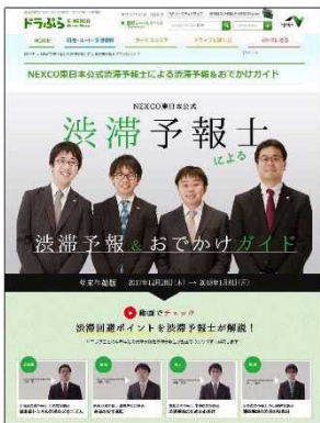
※渋滞予報士(東日本)