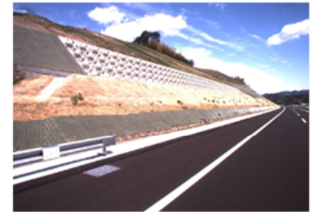
現況写真(御殿場JCT～浜松いなさJCT)