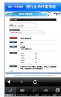
通行止め作業状況