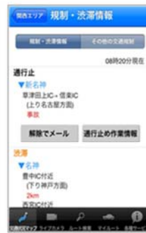
通行止め解除通知