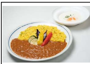
11 西宮名塩SA(上) サフランライスのキーマカレー夏野菜を添えて