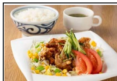
30 伊予灘SA(下) 油淋鶏セット