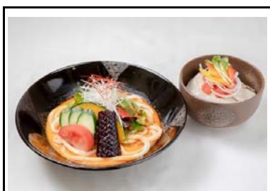
13 加西SA(上) 冷やし坦々うどんと官兵衛のローストポーク丼