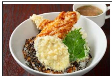
25 石鎚山SA(上) 若鶏と野菜の天井