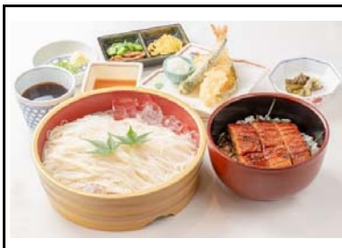
17 龍野西SA(上) 清流定食