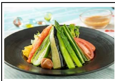
40 金立SA(上) 本日、、令麺日和