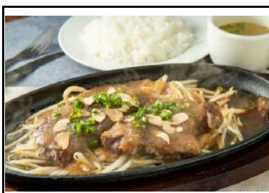
38 広川SA(上) スタミナステーキセット