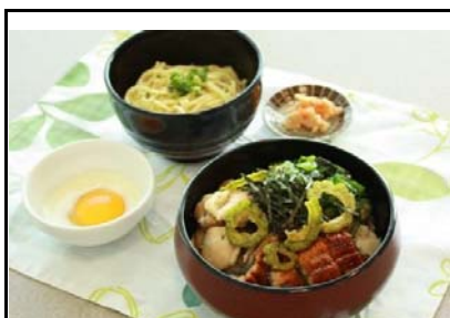
55 伊芸SA(下) うな・チキ・ねば丼