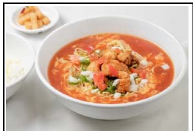
19 明石SA(下) 淡路トマトたこラーメンセット