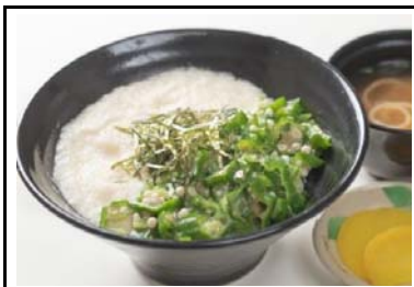
20 宝塚北SA とろろ丼