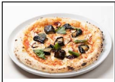
16 三木SA(下) 鍛冶屋風ピザ