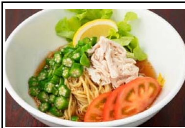
23 吉野川SA(上) 大麦冷麺