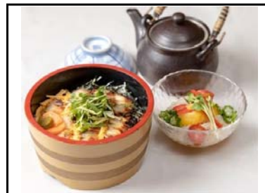
18 龍野西SA(下) あなごのひつまぶし夏野菜そうめんを添えて