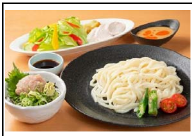
31 豊浜SA(上) オリーブ地鶏と夏野菜のサラダうどん