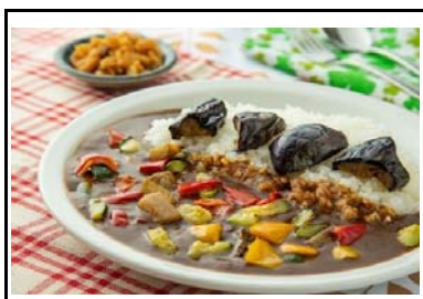
43 別府湾SA(上下) 夏野菜カレー