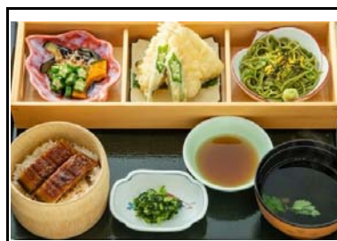
39 広川SA(下) 夏の膳