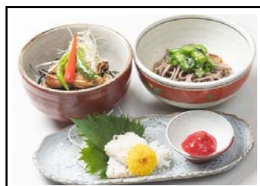
9 西紀SA(上) 穴子飯とネバトロそば御膳