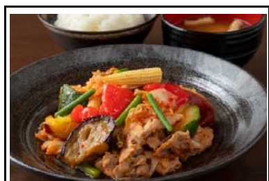
28 入野PA(下) 夏野菜の豚キムチ定食