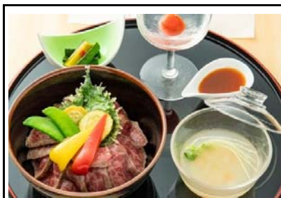
47 北熊本SA(下) あか牛と夏野菜のステーキ丼～冷製冬瓜スープ添え～