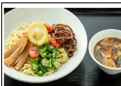
50 桜島SA(上) 冷しちゃんぽん