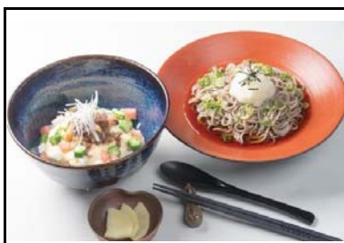
10 西紀SA(下) 但馬牛のねばとろ丼とぶっかけ出石そば