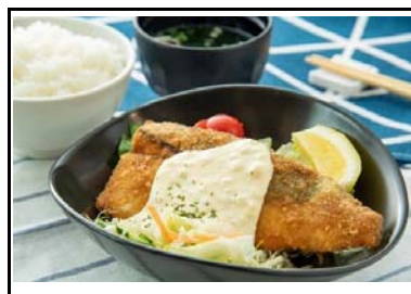
42 山田SA(下) 五島・対馬の旬さばフライ南蛮～たっぷり夏野菜添え～