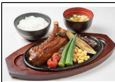
5 岸和田SA(下) 夏野菜とスペアリブのスタミナグリル