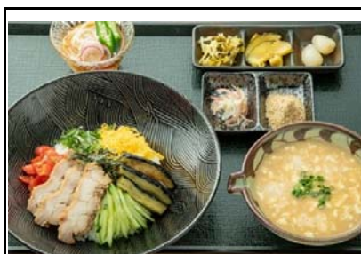
52 霧島SA(上) 霧島冷や汁【和】の御膳【冷和御膳】