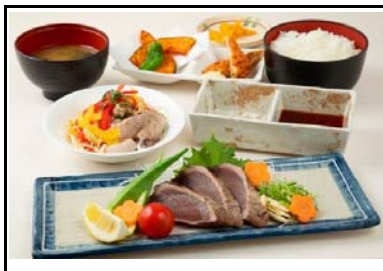
34 南国SA(上) 夏祭り御膳(なつまつりごぜん)