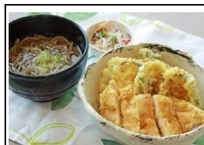
54 伊芸SA(上) とり天丼夏野菜添え(半そば)