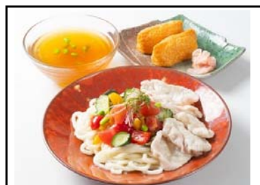
12 西宮名塩SA(下) 豚しゃぶと夏野菜の冷やしあんかけうどんセット