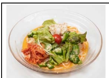
8 香芝SA(上) 夏野菜の辛口冷し坦々うどん