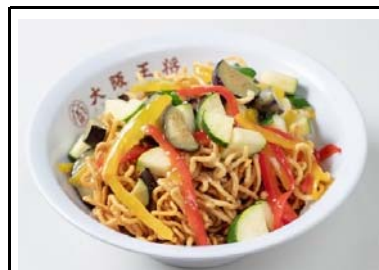
3 吹田SA(上) 彩り夏野菜のあんかけ揚げそば