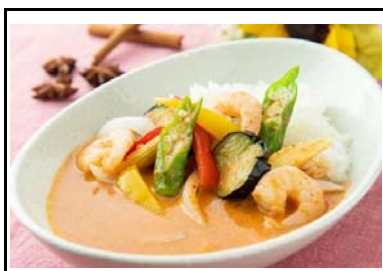
37 古賀SA(下) 夏野菜と海老のスープカレー