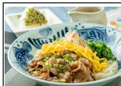
51 桜島SA(下) 冷しゴマダレ肉うどん