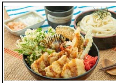
36 古賀SA(上) 鹿児島県産黒豚と季節野菜の天丼～夏野菜～