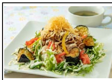
45 川登SA(下) 夏野菜のシシリアンライス