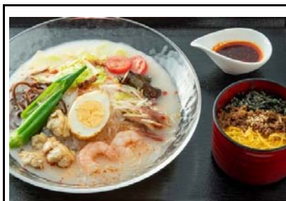
46 北熊本SA(上) 冷やし太平燕 馬そぼろご飯付