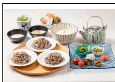
15 三木SA(上) 夏うまいもん夏野菜漬物と出石皿そば