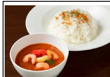
24 吉野川SA(下) 夏野菜のシュリンプカレー