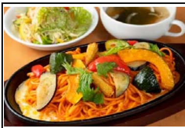
26 石鎚山SA(下) 夏野菜のちやспа(ナポリタン)