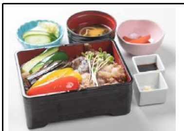
2 大津SA(下) 彩り夏野菜と近江牛重