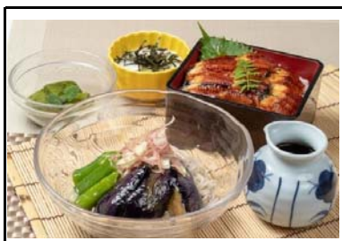
4 岸和田SA(上) 夏のスタミナ鰻重御膳