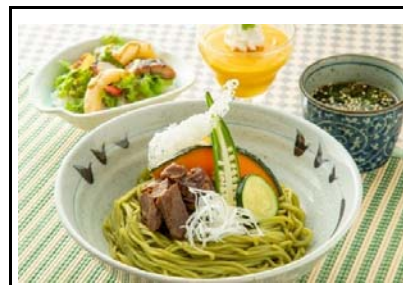
48 宮原SA(上) 馬煮込み茶蕎麦膳