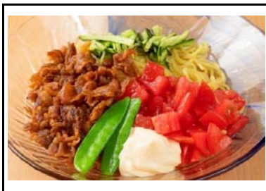
35 南国SA(下) 四万十ポークと夏野菜の冷麺