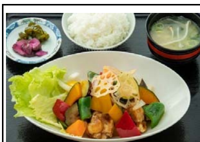
53 霧島SA(下) 夏野菜と鶏の黒酢あんかけ定食