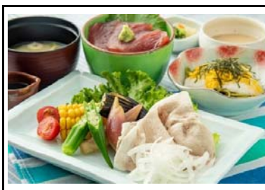
41 金立SA(下) 金立夏御膳