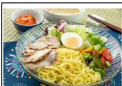
49 宮原SA(下) 夏野菜の冷しつけ麺