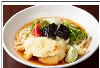
22 上板SA(下) すだち鶏天冷やしぶっかけうどん