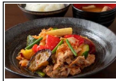
27 入野PA(上) 夏野菜の豚キムチ定食