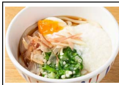
33 府中湖PA(上) 夏のぶっかけうどん