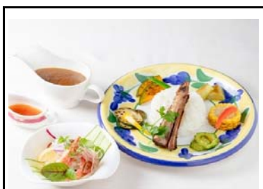
14 加西SA(下) スペアリブと夏野菜のカレーエスニック風サラダうどん添え