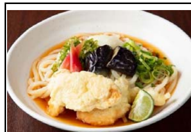
21 上板SA(上) すだち鶏天冷やしぶっかけうどん