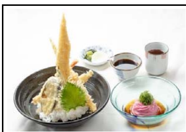
7 紀ノ川SA(下) 夏野菜と太刀魚の天井セット