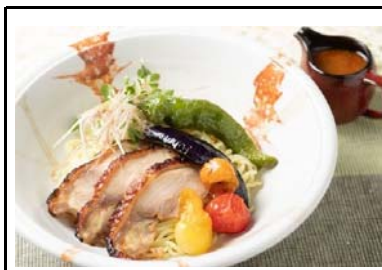
1 大津SA(上) 近江黒鶏チャーシューの冷やし麺