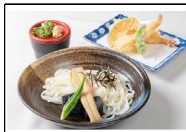
6 紀ノ川SA(上) 旬菜冷やしうどん