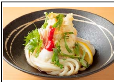
32 豊浜SA(下) 鶏天 梅おろしぶっかけうどん