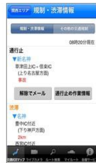
通行止め解除通知