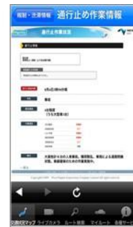
通行止め作業状況