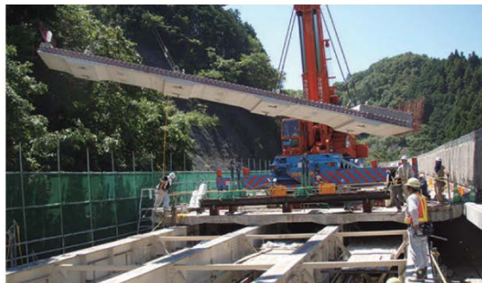
プレストレストコンクリート床版