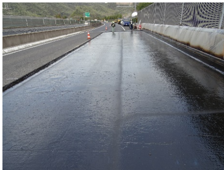
高性能床版防水工

これらのリニューアル工事の他、傷んだ舗装路面の修復、老朽化した道路付属物の取り換え、道路維持作業、道路構造物や設備の点検・補修なども併せて実施いたします。