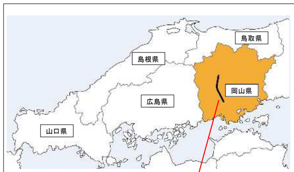
岡山自動車道 (賀陽IC～有漢IC)