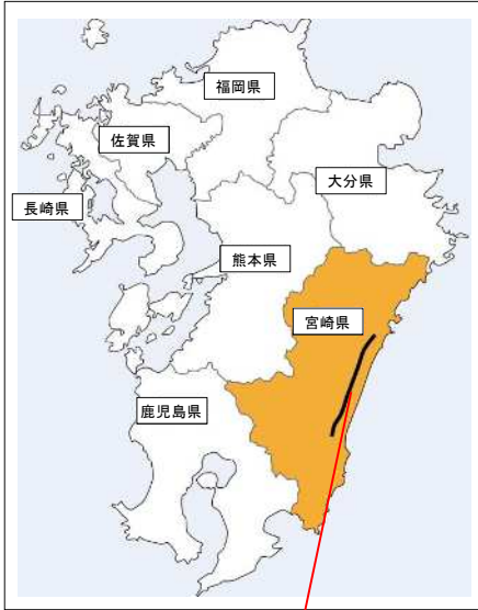
東九州自動車道 (高鍋IC～西都IC)