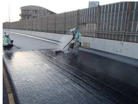
高性能床版防水工

これらのリニューアル工事の他、傷んだ舗装路面の修復、老朽化した道路付属物の取り替え、道路維持作業、道路構造物や設備の点検・補修などもあわせて実施いたします。