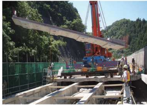
プレストレストコンクリート床版