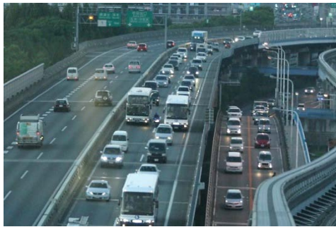
下り線 摂津南 IC～摂津北 IC 間の渋滞状況写真

※IC:インターチェンジ、PA:パーキングエリア、JCT:ジャンクション、TN:トンネル、BS:バスストップ