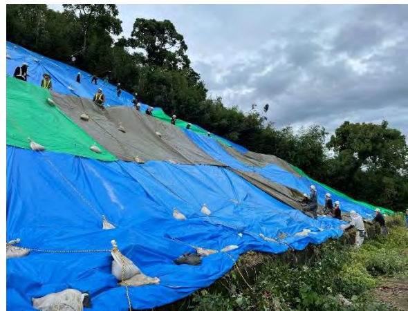
ブルーシート設置