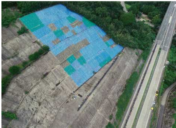
ブルーシート設置