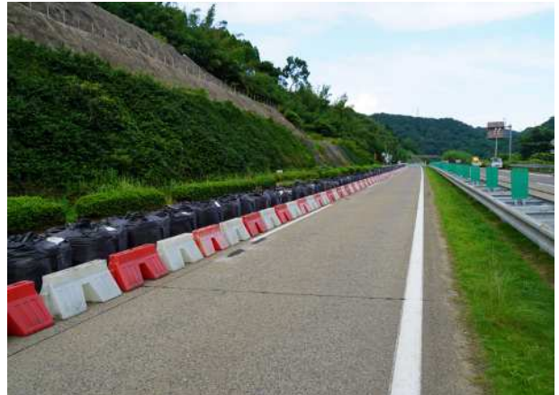
走行車線規制(上り線:福岡方面)

高速道路のご利用にあたっては、最新の気象情報や交通情報をご確認いただきますようお願いいたします。