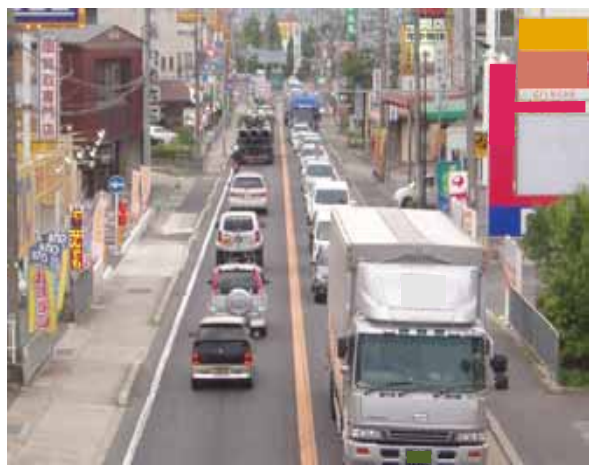
京都府亀岡市下矢田町(下矢田交差点)