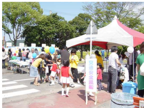
啓発グッズ配布、パネル展示