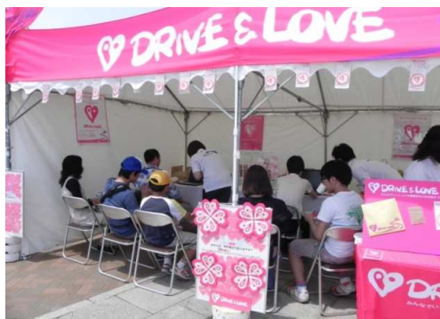
「DRIVE & LOVEプロジェクト」