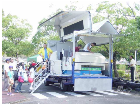
シートベルト効果体験