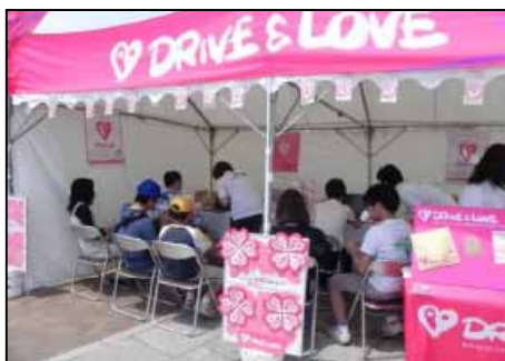
交通事故ゼロを目指す 「DRIVE&LOVEプロジェクト」