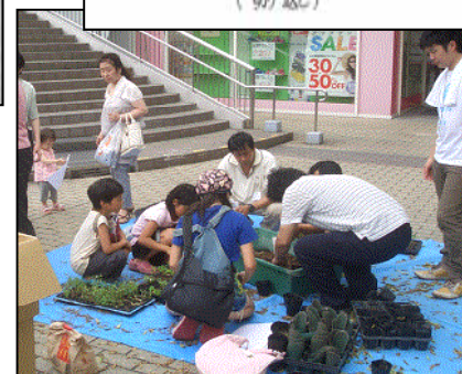
(イベント時使用状況)