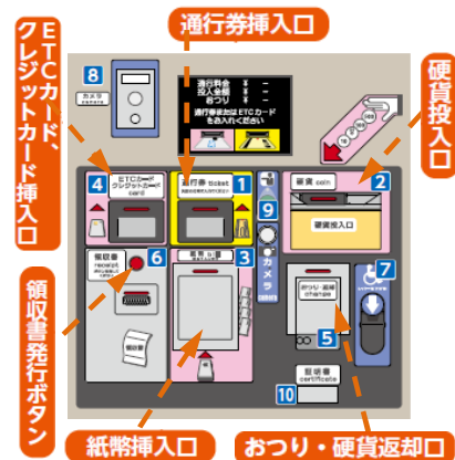
料金精算機(全面パネル)