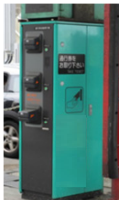
通行券自動発行機